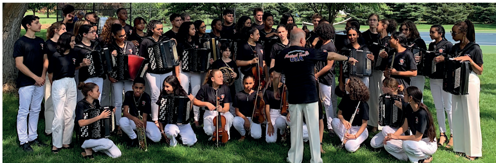
Concert en mode garden party à Cascade.

Suite de la tournée, cette semaine, après Chicago et le Park National Dunes d'Indiana, à Milwaukee et dans l'Iowa avant le retour en fanfare à La Réunion.