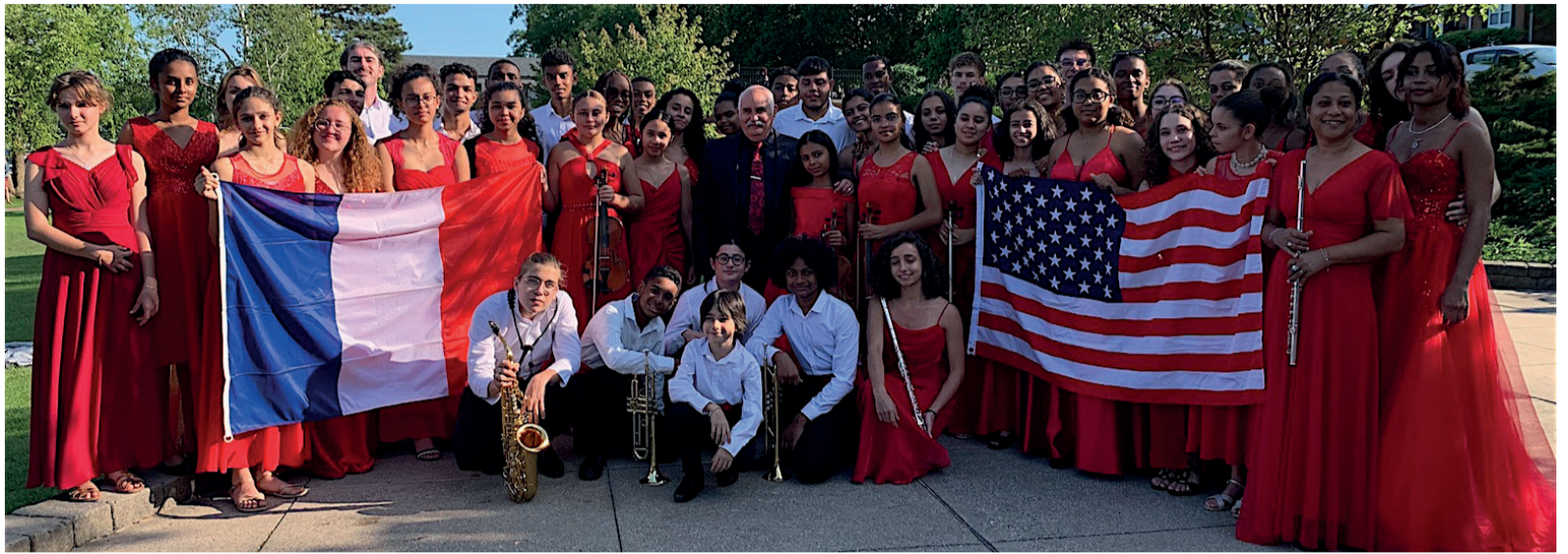
Panache, énergie, même fatigués, ils ont assuré partout dans le pays comme, ici, au Michigan, ces jours derniers, au nom de la France.

Polyphonia y a créé l'ambiance, comme à son habitude, pour un après-midi musical orchestré, là encore, en mémoire de la France et de son Histoire : "Encore un moment irréel, dans un lieu digne des séries télévisées ! Nous étions dans la demeure de l'un des plus grands avocats de la région (1 000 m 2 , piscine, tennis, limousine et cocktail dinatoire luxueux), chacun de nos musiciens appréciant au plus haut point, comme nous-mêmes, cet instant exceptionnel."